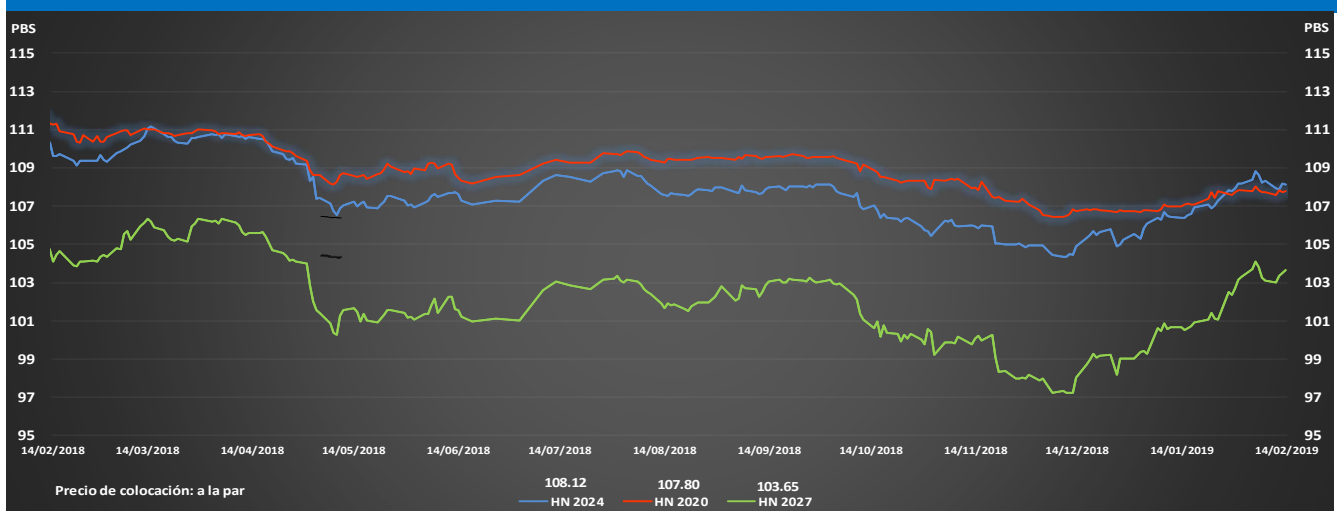
Gráfica de Precios en el Mercado Secundario al 14 de Febrero de 2019