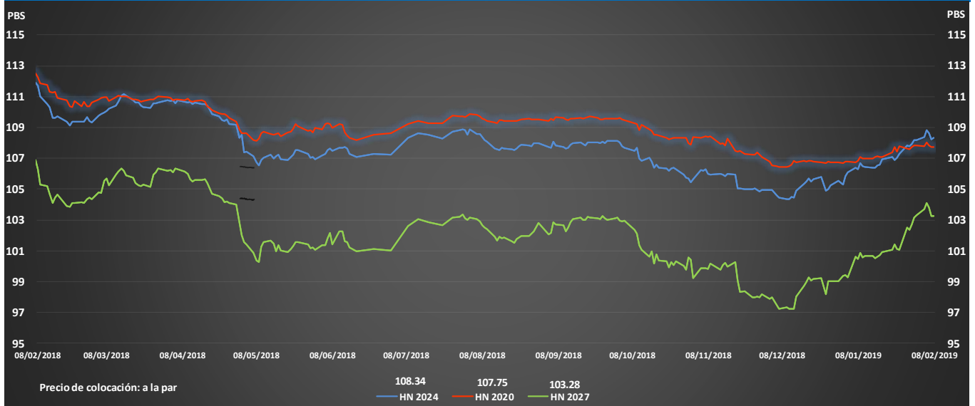
Gráfica de Precios en el Mercado Secundario al 08 de Febrero de 2019